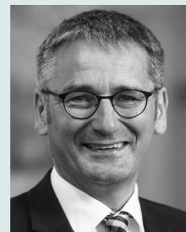
Hendrik Hering Präsident des Landtags Rheinland-Pfalz